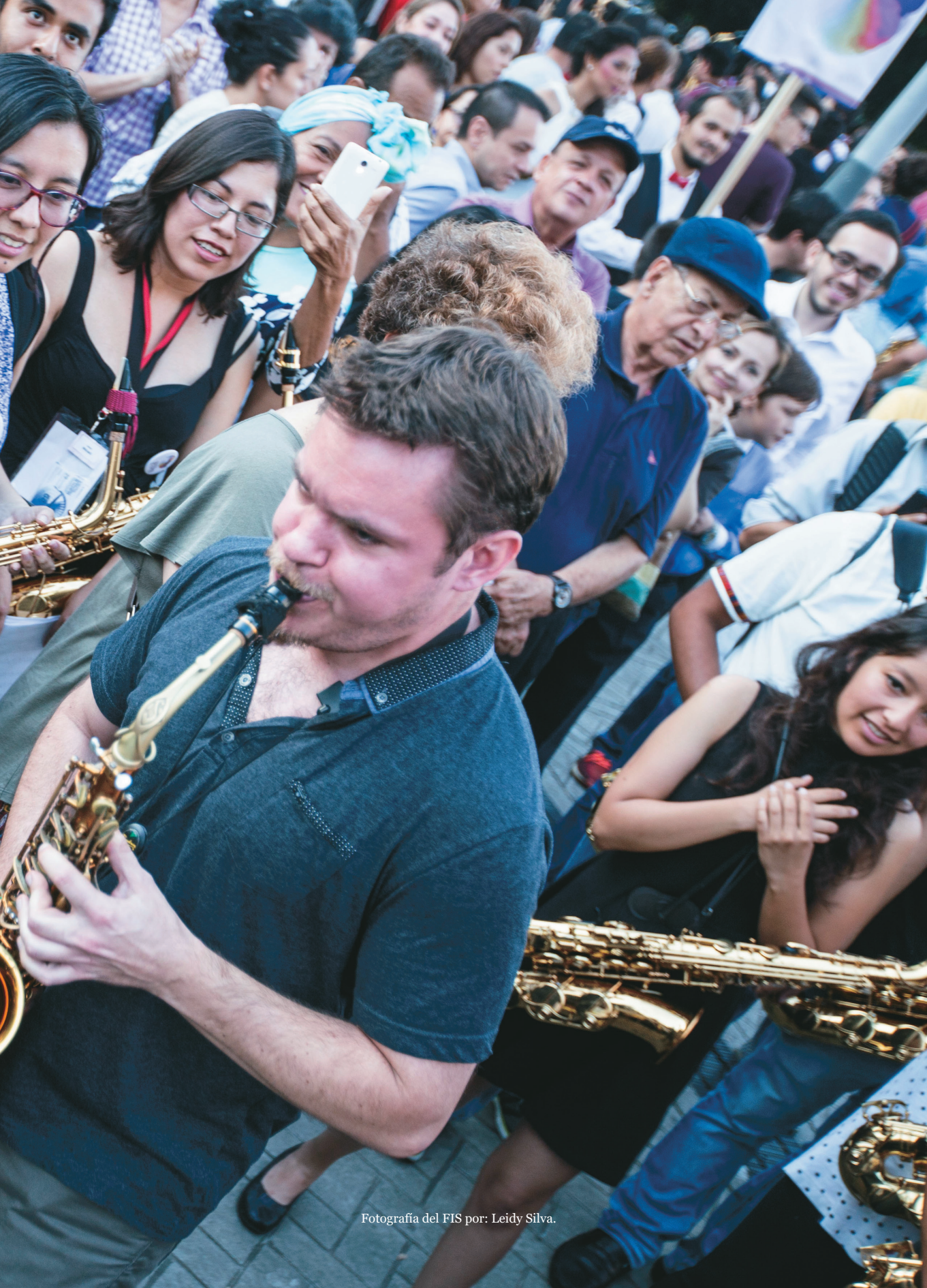
Fotografía del FIS por: Leidy Silva.