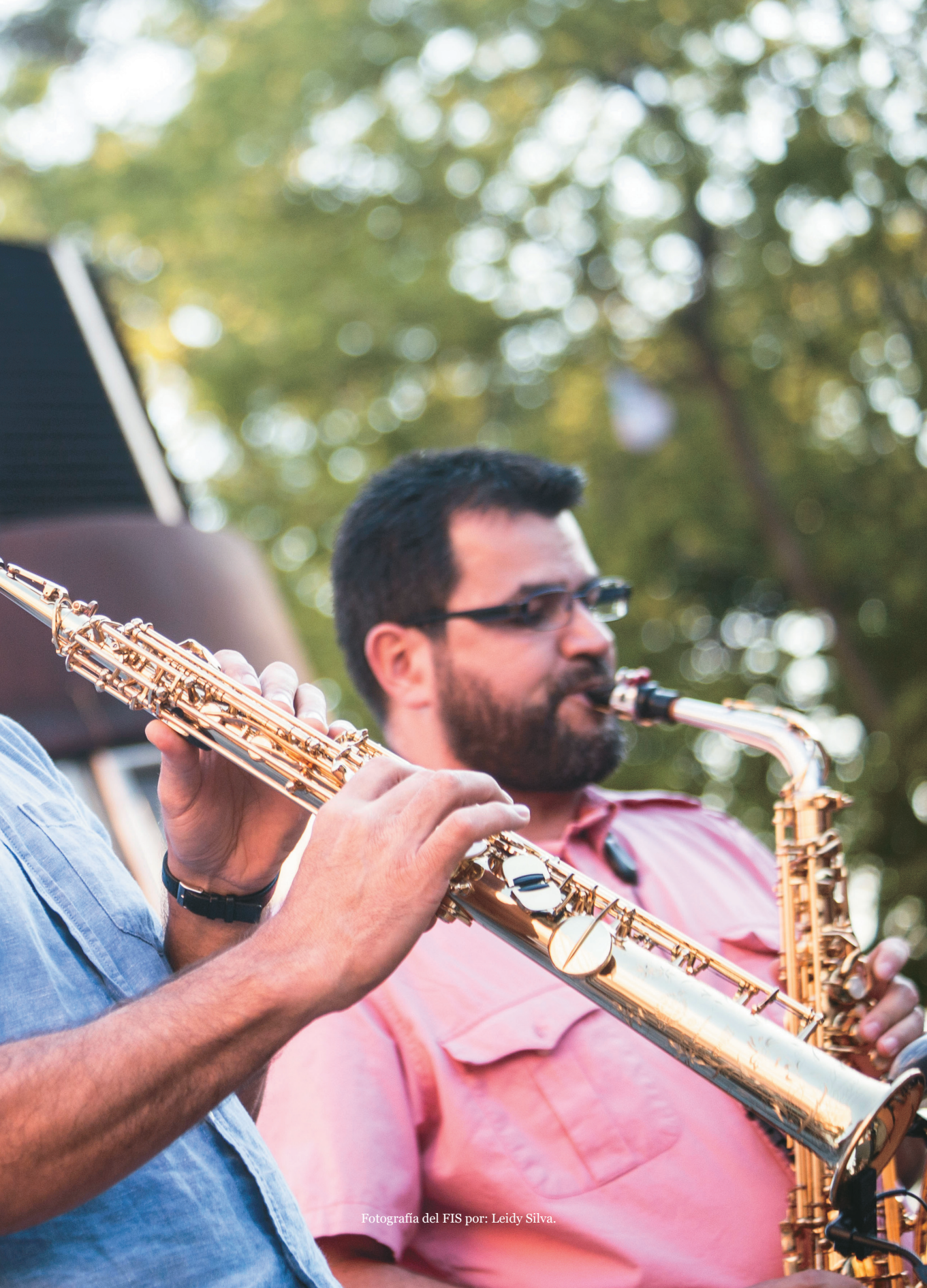
Fotografía del FIS por: Leidy Silva.