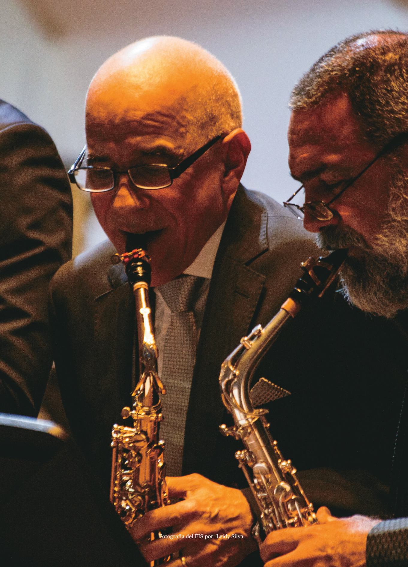
Fotografía del FIS por: Leidy Silva.